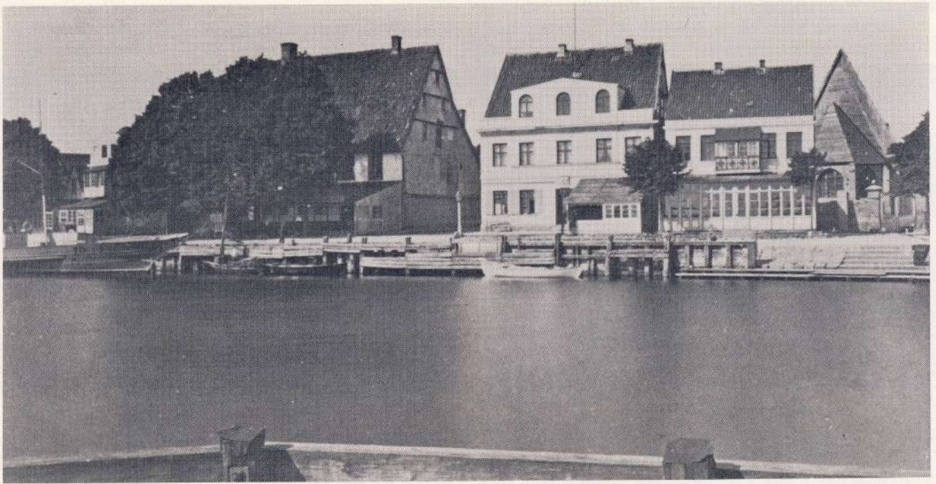
Bild von Warnemünde, von Klempnermeister Heinrich Holz, aus dem Jahre 1898! von rechts nach links: Holzkirche, Reichshof, Hotel Union.