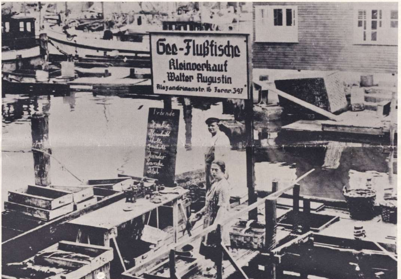
Obiges Bild sandte uns Gisela Köhler. Es zeigt das vielen Warnemündern bekannte Ehepaar Augustin auf ihrem Verkaufsstand am alten Strom.